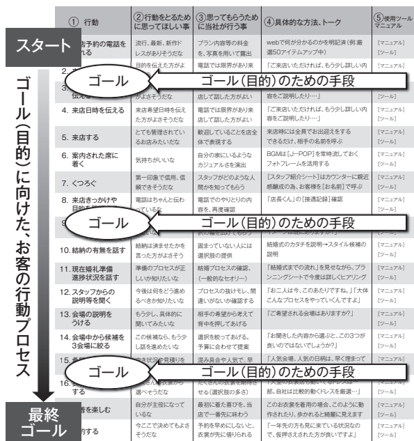
図表5 顧客行動を起点としたアプローチの全体像

（目的）として、「そのため」に社員が何をすべきかを講じるので（手段）、目的と手段が横のラインで明確化されることとなる。このように目的である「何のため」を明確にすると、それを達成